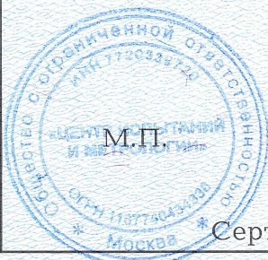
Схема сертификации: 3с.